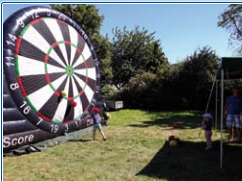
An der Fussball-Dartwand konnten sich Klein und Groß probieren!