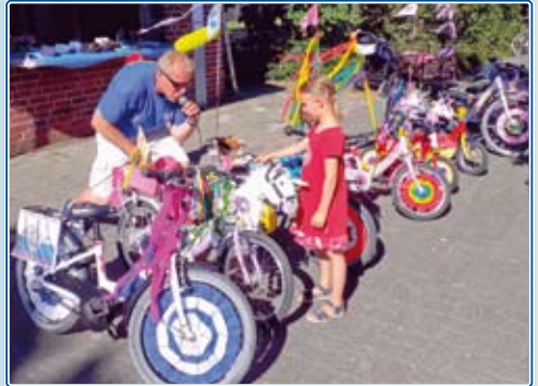
Viele Fahrräder wurden von den Kindern bunt geschmückt