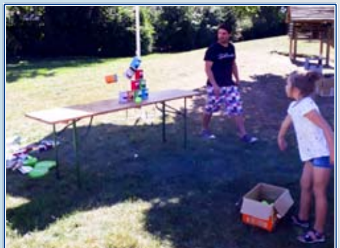
Immer noch beliebt - Dosenwerfen